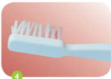
4 5 minuten niet eten en drinken en daarna de vernis wegpoetsen met een tandenborstel. Kleine stukjes uitspugen.