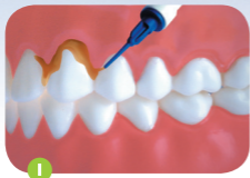
1 Aanbrengen op de tandhals

Met een stompe naald een dunne laag aanbrengen op het tandoppervlak dat moeilijk schoon te maken is met tandenpoetsen. Vermijd contact van de vernis met de tong, chloorhexidine tandvernis smaakt bitter. Gebruik niet meer dan \frac{1}{4} spuitje per keer.