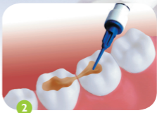
2 Aanbrengen op het kauwvlak